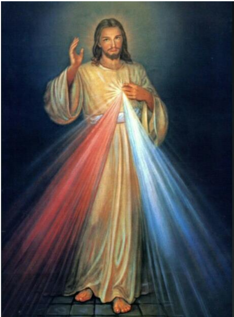
Sanktuarium Miłosierdzia Bożego w Krakowie - Łagiewnikach